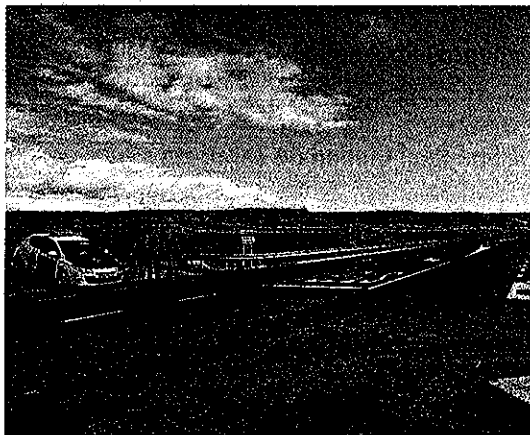
La carretera se inauguró ayer, pero lleva un mes en servicio. A. CALVO

MONFLORITE. Tras un año de obras que terminaron en diciembre, el consejero de Obras Públicas del Gobierno de Aragón, Alfonso Vicente, inauguró ayer el acondicionamiento de la A-1217 (Monflorite a Sena) en el tramo desde la intersección de la carretera A-131 (Huesca-Fraga) hasta el aeropuerto Huesca-Pirineos. Esta mejora, con una inversión de 1,9 millones de euros, tiene una longitud de 4,1 kilómetros. La carretera dispone de dos carriles de 3,5 metros, con arcén de un metro. En total, hay tres rotondas: en la intersección con la A-131, en el acceso a Monflorite y ya en el aeropuerto.