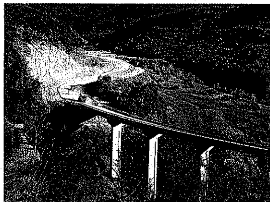
El viaducto de Fanlillo es una de las infraestructuras del trazado.