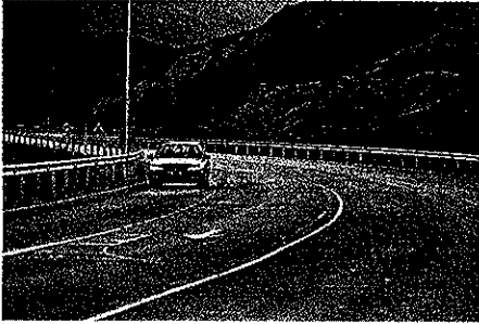
Unos 9 kilómetros desde Sabiñánigo están asfaltados. R.G.