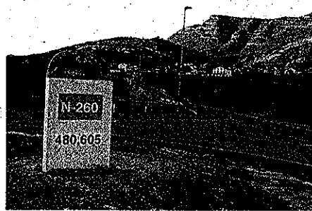
El cruce de Yebra también está bastante avanzado. R.G.